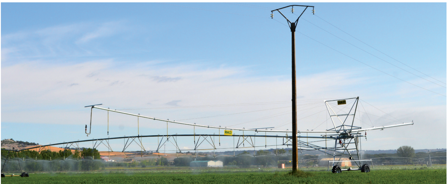
Detalle acoplamiento EXTENDER .